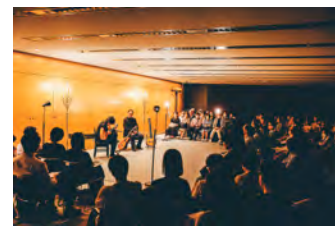
<ホールA 0歳からのコンサート/ホールC・ホールD7・G409 多彩な有料公演の数々>