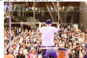
<地上広場 キオスクステージ(無料公演)/ホールE キオスクステージ*/フォル・ニューイ(聴衆参加型イベント)*>